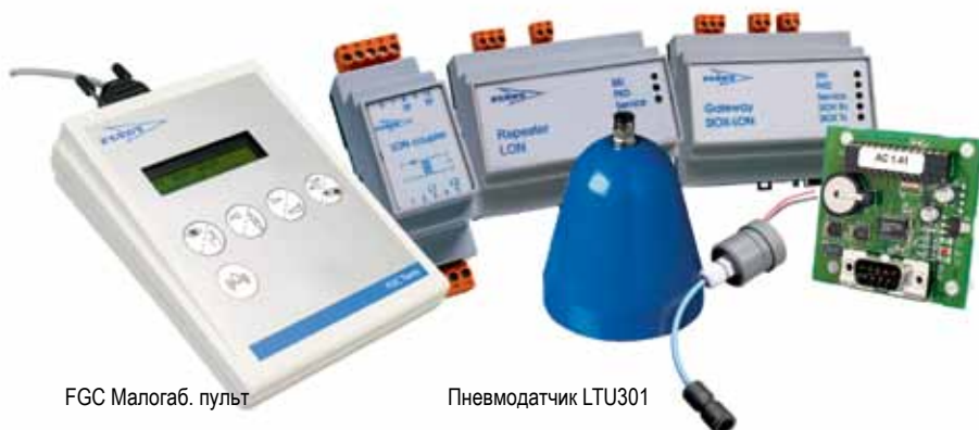
FGC Малогаб. пульт